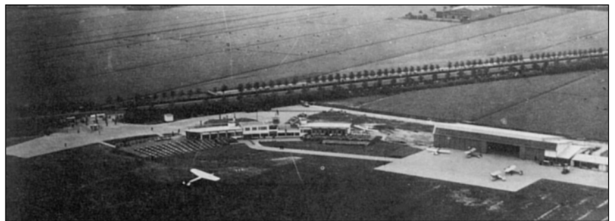
▲ Afb.10. Vliegveld Ypenburg bij Den Haag met rechts het hangartype dat ook voor de vliegloods is gebruikt. Situatie tussen 1936-39. Uit: Jong, A.P. de, Vlucht door de tijd: Koninklijke Luchtmacht 75 jaar, Houten 1988, 53.

Afgaande op de beschikbare informatie is gebleken dat de Vliegloods is opgebouwd uit twee hergebruikte hangars afkomstig van Duitse vliegvelden die in W.O.I hebben gefunctioneerd. De firma Reesink heeft reeds in 1918 de constructiedelen ten behoeve van de loods aangekocht. In 1921 zijn deze tot een nieuwe loods met een verbindende lichtstraat getransformeerd. Daarbij is de constructieve en ruimtelijke opzet van de hangars nagenoeg ongewijzigd gebleven. Vliegtuighangars uit deze periode zijn in Nederland, maar ook in Duitsland, zeer zeldzaam. Slechts enkele exemplaren zijn bewaard gebleven. De Vliegloods is bovendien letterlijk groot industrieel erfgoed. Grote hallen en loodsen met geklonken vakwerkspanten en –liggers zijn in Nederland betrekkelijk zeldzaam geworden. In Zutphen is de Vliegloods de oudste, nog bestaande bedrijfshal van deze omvang. Het zou mooi zijn als dit voor Zutphen en Nederland unieke deel van haar industrieel verleden behouden kon blijven. Streven naar behoud ter plekke verdient natuurlijk de voorkeur. Mocht dit niet haalbaar zijn, dan is er wellicht na demontage een luchtvaartmuseum gelukkig mee te maken. De aankoop van een Concorde door het Techniekmuseum te Sinsheim (D) lijkt bijna aanleiding genoeg. In de Vliegloods is ruimte in overvloed! ■