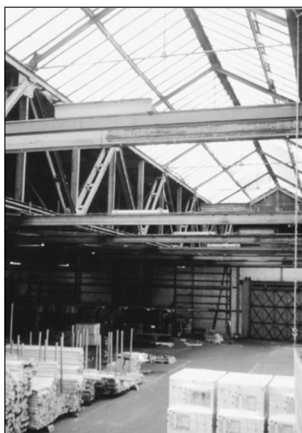
▲ Afb.3. Centrale lichtstraat in de Vliegloods