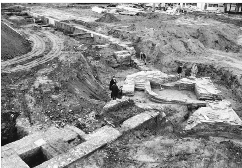
▲ Stadsmuur met Blanckentoren tijdens de opgraving in 1997

Op deze plaats stond van ca. 1320 tot 1854 de Reinmakerstoren als onderdeel van de stadsmuur van de Nieuwstad. Deze ommuring kwam tot stand kort na de samenvoeging in 1312 van Zutphen en de Nieuwstad onder één bestuur. In de halfronde toren woonde na de middeleeuwen de stadsreinmaker, een straatveger in stedelijke dienst. Onder de school liggen de resten van de Blanckentoren. Dit was de noordoostelijke hoektoren van de ommuring. De toren was vierkant en leek op de westelijke tegenhanger: de nog bestaande Kruittoren. De Blanckentoren was hoger en werd in de 15e eeuw wit gepleisterd, vandaar de naam, en voorzien van een hoge spits. Beide torens werden in 1854 gesloopt om plaats te maken voor de cavaleriestallen van de Isendoornkazerne. De Blanckentoren werd in 1997 opgegraven en is onder de school bewaard gebleven en aldaar in de vloer te zien. De Reinmakerstoren werd in 1999 ontdekt. De afbeelding op de steen in gebaseerd op een prent die een anonieme tekenaar in 1854 maakte van de sloop van de torens (zie