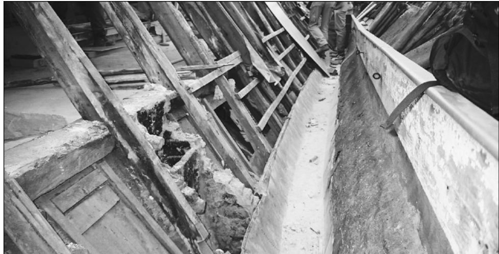
▲ Restaureren betekent ook groot onderhoud. Rechter kapvoet en goot van Beukerstraat 45 tijdens recente werkzaamheden.

Eigenaren van rijksmonumenten, die hun restauratie fiscaal kunnen verrekenen kunnen een beroep doen op de regeling. Van fiscaal verrekenen is sprake als de restauratiekosten ten laste kunnen worden gebracht van het fiscale inkomen of van de fiscale winst. Of dat het geval is wordt bepaald door het Bureau Monumentenpanden van de Belastingdienst (BBM)