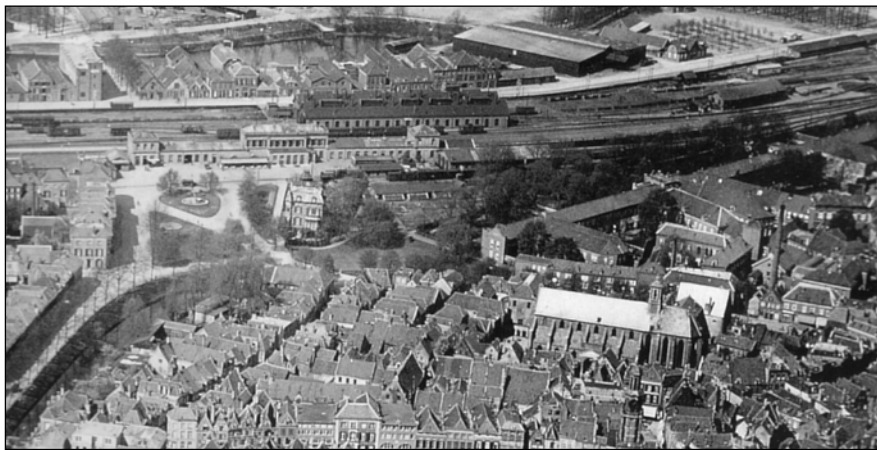
▲ Afb.6. Luchtfoto uit 1928 van een deel van de binnenstad met boven de Vliegloods in de oorspronkelijke ruimtelijke context met haven en rechts boven het oude Veemarktterrein