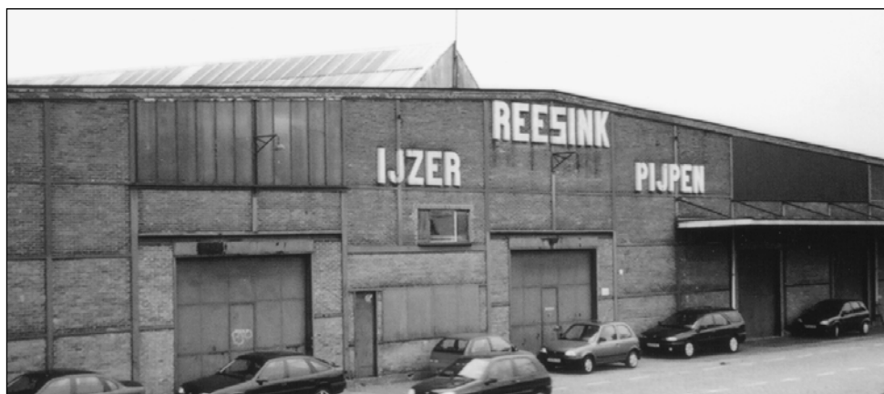
▲ Afb.1. Voorgevel Vliegloods, Havenstraat

De noordzijde van het Zutphense spooreplacement wordt momenteel gedomineerd door de pakhuizen en kantoren van de firma Reesink. Onlangs heeft Reesink al haar activiteiten naar Apeldoorn verplaatst en zijn de gebouwen leeg komen te staan. Het bedrijf dat onder meer handelt in stalen