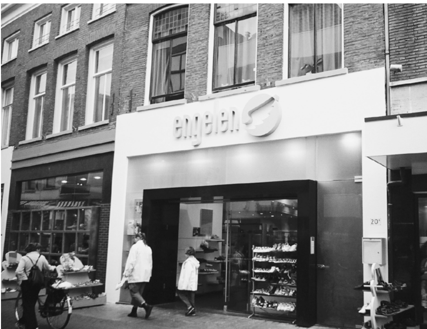
▲ De twee nieuwe puien van Beukerstraat 20 (links) en 22, ontworpen door KdW Architecten.

De Beukerstraat vormt vanouds een belangrijke winkelstraat in het centrum van de stad. De straat maakt deel uit van het zogeheten Rondje. In de dertiende eeuw hadden zich hier al tal van handelaren en ambachtslieden gevestigd. De naam Beukerstraat is te danken aan één van deze ambachtelijke functies, want Beuker is afgeleid van het middelnederlandse, respectievelijk westduitse woord Bodiker en Budicker dat kuiper betekent. Nog steeds luidt de moderne Duitse vertaling voor kuiper "Böttger".