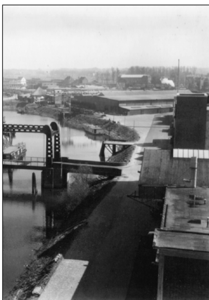
▲ Afb.2. Achterzijde Vliegloods, Noorderhaven, ca 1965