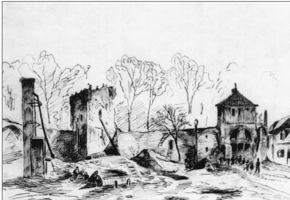
▲ Sloop Blanckentoren en Reinmakerstoren, 1854 Tek. coll. Stedelijke Musea Zutphen

De afgelopen jaren zijn er in de binnenstad van Zutphen regelmatig straten op de schop gegaan. Meestal ging het om de vervanging van de riolen, waarbij ook de bestrating werd vernieuwd. Tijdens het grondwerk in de straten vond er een intensieve archeologische begeleiding plaats. Er valt immers in een diepe riolsleuf veel te zien en te leren van de opbouw en de ouderdom van de straten en andere zaken die aan het licht komen.