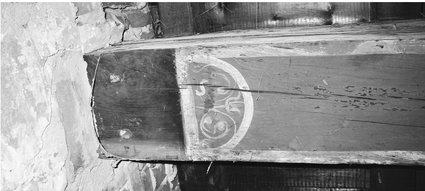
▲ Eén van de aangetroffen oude moerbalken bij de oplegging in de muur. Goed zichtbaar is de ongedecoreerde plek aan de onderzijde van de balk, die de plaats markeert van een in het verleden verwijderd sleutelstuk.

nog aftekenen. Het lunet sluit daardoor niet aan op de muur, maar zo'n dertig centimeter er vanaf. Bij nadere beschouwing bleek in elk lunet nog een zeer fijn geschilderd natuurlijk motief aanwezig te zijn. Het geheel maakt zeer waarschijnlijk deel uit van een meer omvangrijke decoratie uit de tijd van de nieuwbouw uit circa 1450. Een tweede belangwekkende vondst is een muurschildering op de begane grond, die toevallig werd aangetroffen achter een gemetselde voorzetwand. Het gaat om een beschilderd muurdeel van ca. 2 meter breed en 2 meter hoog. De beschildering is in het verleden met diverse lagen witselkalk overgeschilderd en gaandeweg vergeten. Bij het slopen van de voorzetwand scheen er kleur door de witsellagen heen en hier en daar had de witselkalk losgelaten. Reden om een specialist in te schakelen, die het geheel uit rond 1600 dateerde. Op moment van verschijnen van deze editie wordt de muurschildering gerestaureerd, hetzelfde zal met het plafond gebeuren. Meer hierover in een volgende Zutphen MoNumentaal. ■