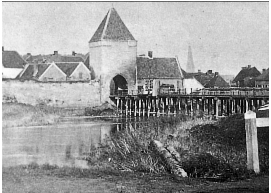
▲ Spitaalpoort, 1876

Op deze plaats stond de Spitaalbuitenpoort. Het was een eenvoudig vierkant poorthuis met een spitsboogvormige doorgang en een puntdak. De poort werd omstreeks 1390 aan het einde van de Spitaalstraat gebouwd als onderdeel van de omwalling van de Spitaalstad (Polsbroek). Dit nieuwe stadsdeel werd echter niet volgebouwd. De Spitaalstraat ontstond als uitvalsweg buiten de 13e-eeuwse stadsomwalling van de Oude Stad. De straat is genoemd naar het klooster 'Spitaal' van de broeders van de orde van de Heilige Geest die zich bezig hiel-