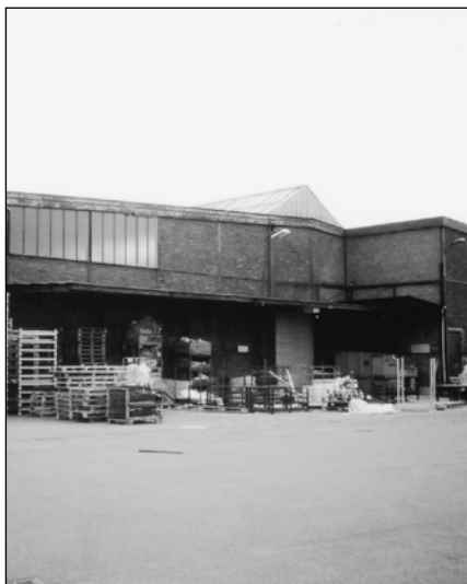
▲ Afb.5. De Havenzijde van de Vliegloods vertoont nog de verspringende plattegrond uit de bouwtijd.