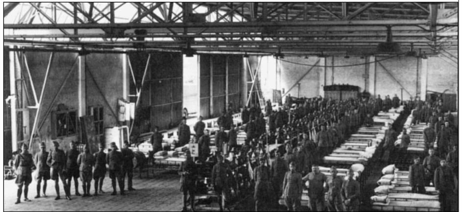
▲ Afb.7. De Legering van de 4e Verkenningsgroep op vliegbasis Bergen, late jaren 30 van de twintigste eeuw. Opvallend zijn de constructieve overeenkomsten van de loods met de Zutphense Vliegloods. Uit: Jong, A.P. de, Vlucht door de tijd: Koninklijke Luchtmacht 75 jaar , Houten 1988, 57