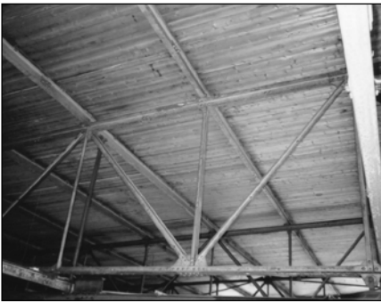
▲ Afb.4. Het dak rust op geklonken vakwerkspanten